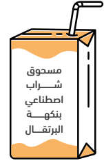
مسحوق غير محلي

إذا وجدت عبارة غير محلى على بطاقة " مساحيق المشروبات الاصطناعية المنكهة" فهذا يعني أن المنتج لم تتم إضافة السكر له أو أي من المحليات البديلة للسكر